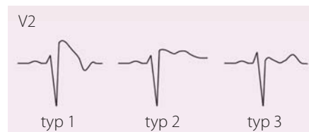
Obr. 1. EKG projevy Brugada syndromu, jediný „diagnostický“ je typ 1, tj. ST elevace ≥ 2 mm následovaná negativní vlnou bez izoelektrické nebo s minimální izoelektrickou linií, zvaný také „Coved type“; další dva typy nazýváme „Saddle back“ – typ 2 má mít výše J bod než T vlnu, typ 3 naopak. Upraveno dle [21,22].

dominantní primárně elektrická porucha bez strukturálního srdečního onemocnění projevující se ST elevacemi, negativními T v pre-kordiálních svodech; postupně byly popsány tři typy dle povrchového EKG (obr. 1). Onemocnění se vyznačuje zvýšeným rizikem NSS na fibrilaci komor, obzvláště při teplotách nebo ve spánku [22]. EKG obraz se u jednotlivého pacienta může měnit, demaskovat typický EKG projev (typ I) lze pomocí ajmalinového testu, který ale není zcela bez rizika indukce maligní arytmie. Později byly u BrS popsány i strukturální změny, hlavně pravé komory. Tímto se otevřela diskuze o patofyziologii, rizikové stratifikaci, typu možné léčby, ale i úloze nejčastěji zmiňované „kauzální“ mutace (je známo již přes 100 mutací) genu SCN5A , který kóduje \alpha -podjednotku natriového kanálu [23]. Genetické testování je doporučeno u rodinných příslušníků pacienta s prokázanou kauzální mutací v genu SCN5A [16]. Léčebné možnosti BrS tkví v implantaci ICD – ze sekundární prevence u pacientů, kteří prodělali fibrilaci komor; z primární prevence u pacientů se spontánním BrS typem 1 na povrchovém EKG a synkopou. Z léků se používá chinidin, a to i v případě elektrické bouře [22]. Jako viabilní léčebná varianta u vybraných nemocných se prosazuje katetrizační ablace – modifikace epikardiálního substrátu ve výtokovém traktu