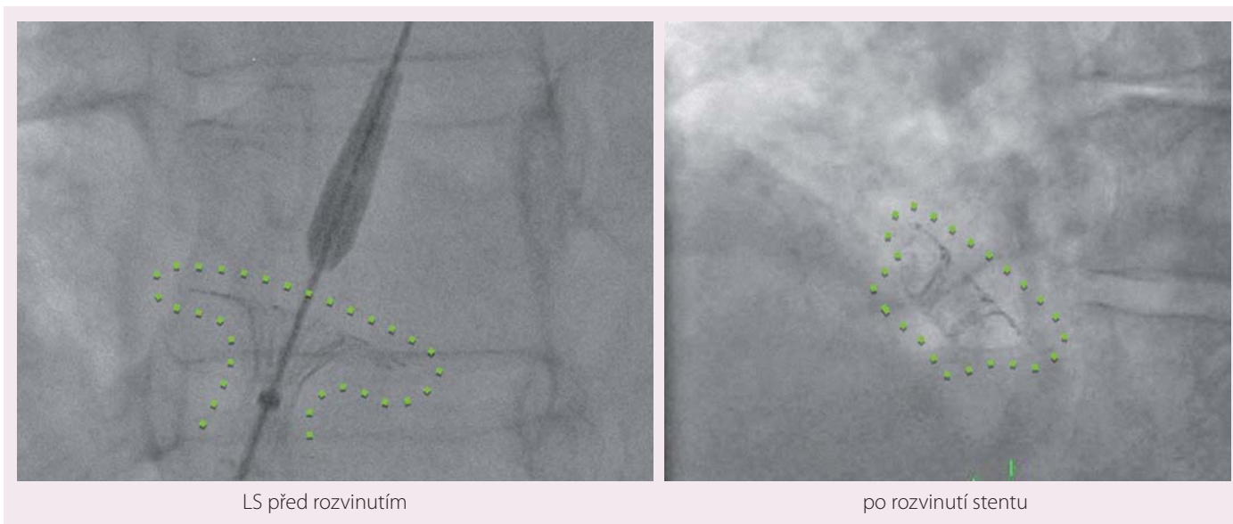
LS před rozvinutím

Dalším kritériem pro zařazení byl průkaz poruchy diastolické funkce levé komory pomocí echokardiografie pomocí pulzní dopplerovské a tkáňové echokardiografie a průkaz zvětšení levé síně. Pacienti s anamnézou cévní mozkové příhody, hluboké žilní trombózy, plicní