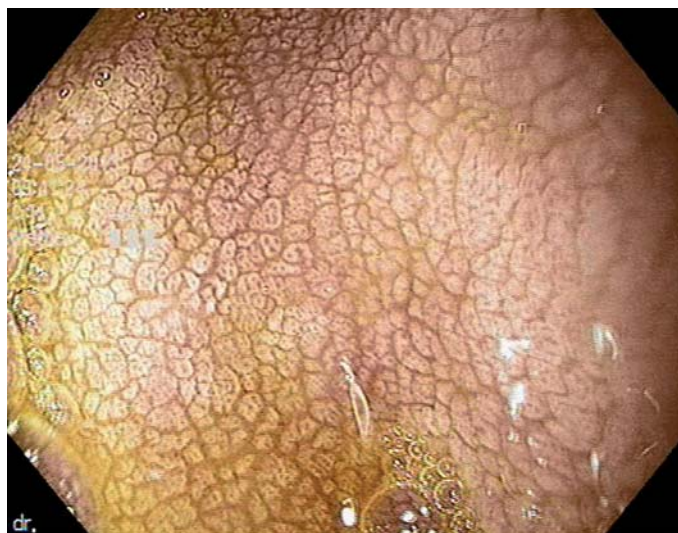
Obr. 2. Atrofická sliznice duodena u pacienta s celiakií.

Až u 50 % dospělých pacientů jsou patrné projevy hyposplenizmu nejasné etiologie, u dětských pacientů je vidán vzácně. Při těžší malabsorpci vitamínu K může docházet k projevům hemoragické diatézy [1].