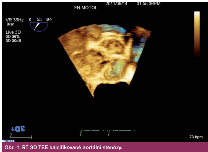
Obr. 1. RT 3D TEE kalcifikované aortální stenózy.

Kalcifikacemi aortální chlopně i kalcifikacemi protrudujícími do stěny aorty se tvar oblasti výtokového traktu, aortální chlopně, kořene a ascendentní aorty deformuje a odchyluje se od původního cirkulárního průřezu, takže měření z dvojrozměrného (2D) obrazu nemusí zachytit reprezentativní hodnoty. RT 3D TEE umožňuje zaznamenat a uložit kompletní dataset tvaru kulové výseče, který tyto struktury obsahuje. Používáme nejčastěji tzv. zobrazení „full-volume“ vzniklé rekonstrukcí ze čtyř cyklů či zobrazení „zoom“ získané během jednoho cyklu (obr. 1). Z těchto