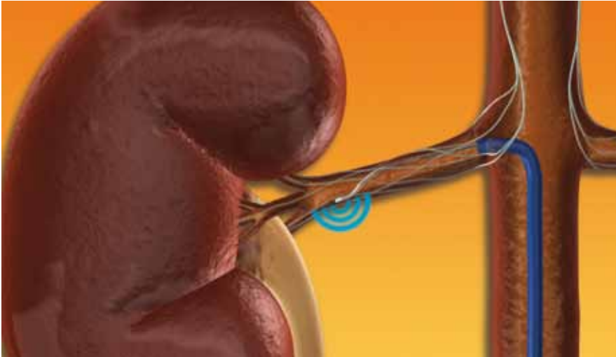
Obr. 1. Místo aplikace radiofrekvencního proudu v renální tepně (Medtronic, Česká republika).

tak vede ke snížení noradrenalinu v ledvinách, což se projeví snížením tvorby reninu a zvýšením průtoku renální tepnou. Snížením aferentních impulzů vedoucích z ledvin do CNS dochází k poklesu celkového tonu sympatiku.