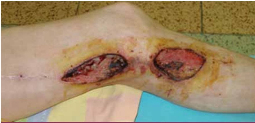
Obr. 1. Infekcia a dehiscencia operačných rán 1 mesiac po implantácii femoro-popliteálneho distálneho bypasu s autológnu reverznou vena saphena magna na ľavej dolnej končatine. Obnažený priechodný bypas v operačnej rane nad kolenom. (Fotodokumentácia z materiálu Oddelenia cievnej chirurgie FNŠP J. A. Reimana Prešov).

uskutočnených u 209 pacientov s vekom nad 70 rokov (tab. 1, 2).