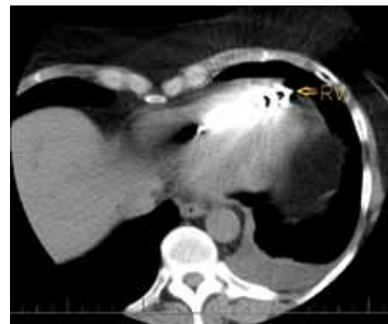
Obr. 2. CT vyšetření hrudníku – hrot defibrilační elektrody pravděpodobně zasahuje mimo srdeční konturu, nelze však jednoznačně odlišit případnou perforaci myokardu od artefaktů způsobených elektrodou (RV – defibrilační elektroda).

Pacientka byla přeložena na kardiochirurgické pracoviště k extrakci defibrilační elektrody za kontroly jícnovou echokardiografií. Výkon proběhl bez komplikací, dle kontrolního echokardiografického vyšetření přetrvával jen drobný perikardiální výpotek – šlo však o stacionární nález. Následně s odstupem dvou týdnů byla pacientce zavedena nová defibrilační elektroda s umístěním do spodního septa pravé komory (Durata 7F 7120Q/65 cm, St. Jude Medical, Inc., Minnesota, USA) a byl připojen původní defibrilátor. Parametry citlivosti a stimulace změ-