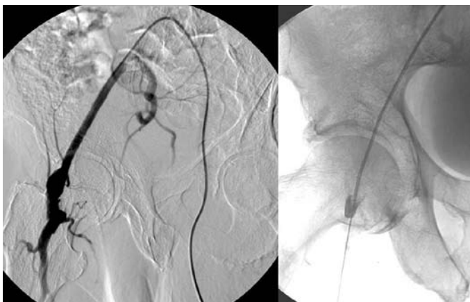
Obr. 2. Zavedení katetr do femoropopliteálního bypassu k lokální trombolýze.