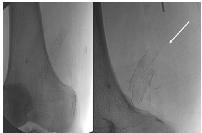
Obr. 4. Fraktura stentu v popliteální oblasti (šipka – nativní obraz).

škození stentu ve femoropopliteálním segmentu dochází kvůli působení velkých dynamických sil (axiální komprese a cyklická flexe) v této oblasti během flexe kolena [8–10]. Fraktura stentu vedla v tomto případě k reokluzi cévní rekonstrukce, která byla opět vyřešena endovaskulárně. Podle zavedené praxe implantace stentu do protetického bypassu není doporučena a rutinně se neprovádí. Pokud je chirurgická léčba proveditelná, je vždy preferovaná. Implantace stentu v této oblasti musí být rezervována pouze pro případy, kdy je chirurgické řešení vysoce rizikové a končetina akutně ohrožena.