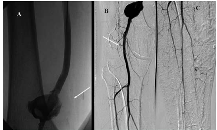
Obr. 3. Kontrolní angiografie po 24 hod trombolýzy prokazuje průchodný bypass (panel A) a velké pseudoaneuryzma v místě minulé implantaci stentu (panel B) a dobře průchodné bérčové tepny (panel C).