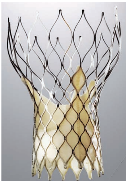
Obr. 2. CoreValve Revalving System má samoroztažitelnou trojčípou chlopeň z vepřového perikardu.

dalším nemocným v terminálním stadiu kritické aortální stenózy. Přesto se zprvu nezdálo, že katetrizační implantace aortální chlopně najde širší klinické využití – výkon byl komplikovaný, špatně technicky proveditelný s nejistým dlouhodobějším efektem. Následující roky však byly ve znamení poměrně rychlého paralelního vývoje zkušeností se dvěma systémy, které dnes již mají CE značku a jsou komerčně dostupné: Edwards-Sapien (Edwards Lifesciences Inc, Kalifornie, USA) a CoreValve Revalving System (CRS TM, CoreValve Inc, Irvine, Kalifornie, USA). Systém Edwards-Sapien (obr. 1) je balónkem roztážitelná tříčípá chlopeň z hovězího perikardu (původně byla z koňského perikardu). Zatím je dostupná ve velikostech 23 mm (zaváděcí systém 22 Fr) a 26 mm (zaváděcí systém