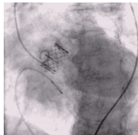
Obr. 6. Implantovaná chlopeň Edwards-Sapien v aortální pozici.

vého (původně hovězího) perikardu ve velikostech 26 a 29 mm, kterou lze zavést přes 18 Fr zavaděč.