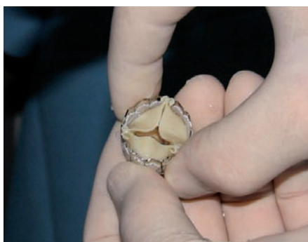
Obr. 1. Systém Edwards-Sapien je balónkem roztážitelná tříčípá chlopeň z hovězího perikardu.