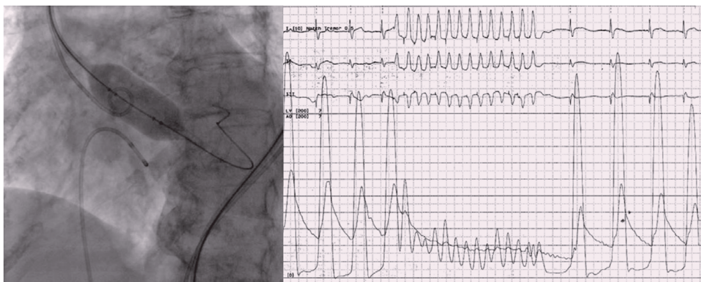
Obr. 3. Před implantací chlopně je prováděna balónková valvuloplastika za praktické krátkodobé zástavy oběhu dosažené rychlou stimulací komor.