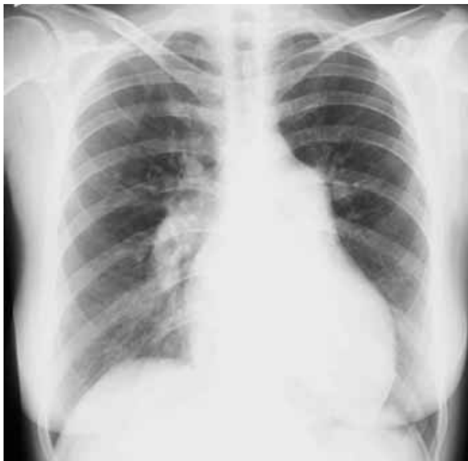
Obr. 3. Skiagram hrudníku u nemocné s pokročilou plicní arteriální hypertenzí. Aortální knoflík je nevýrazný. Levá kontura srdeční je tvořena zvětšenou pravou komorou. Šířka pulmonálního segmentu: 55 mm, šířka sestupné větve pravé plicnice: 23 mm.

Cílem oxygenoterapie je dosáhnout saturace tepenné krve kyslíkem nad 90 %. Indikace