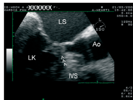
Obr. 3. Transezofageální echokardiografie, zoom na oblast výtokového traktu LK. Je přítomen dopředný pohyb předního cípu mitrální chlopně (šipky), který zcela obturuje výtokový trakt LK v období střední systoly.

Popisy nálezu nitrokomorové obstrukce při použití 1D-echokardiografie již patří minulosti, nicméně ještě v současné době se při omezené vyšetřitelnosti pacienta můžeme orientovat podle systolického přiblížení předního cípu mitrální chlopně a subvalvulárního aparátu (konkrétně šlašinek jdoucích k přednímu cípu) k proximálnímu segmentu IVS