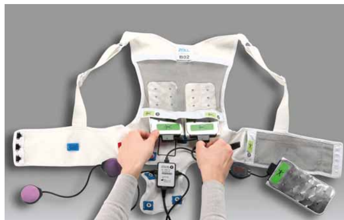
Obr. 2. Wearable kardioverter defibrilátor.

Primární cíl – koronární úmrtí, nefatální IM, ischemická CMP nebo nestabilní AP vyžadující hospitalizaci