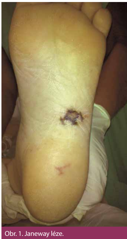
Obr. 1. Janeway léze.

Prvotními důvody kontaktu pacienta se zdravotní péčí jsou nespecifické příznaky, především horečka, dále pak ischemické projevy systémové embolizace (mozková příhoda, infarkt sleziny, ledviny, akutní mezenterální ischemie apod.) a infekční projevy systémové embolizace (periferní abscesy). U těchto projevů budí podezření na IE především jejich kombinace (horečka ve spojení s novým srdečním šelestem či periferními embolizacemi) nebo netypický charakter (nevysvětlitelné abscesy a jejich neobvyklá lokalizace). Bohužel, většinou až později v průběhu onemocnění bývají zachyceny specifičtější, ale poměrně vzácné příznaky. Spíše u akutních forem IE bývají přítomny Janewayovy léze (nebolestivé nepravidelné tmavé hemoragické makuly, nejčastěji lokalizované na dlaních, ploskách nohou či plantární ploše prstů, trvající dny až týdny). Ke kožním projevům při protražovaném průběhu IE patří i Oslerovy uzlíky (bolestivé růžové noduly, často s bledým centrem, vyskytující se na prstech rukou či prstcích nohou, výsev je prchavý, trvá hodiny až dny, častěji u „subakutně“ probíhajících endokarditid). Výskyt těchto projevů se odhaduje na asi 2–5 % případů, zatímco v předantibiotické éře se vyskytovaly ve k tvorbě imunokomplexů s následnou imu-