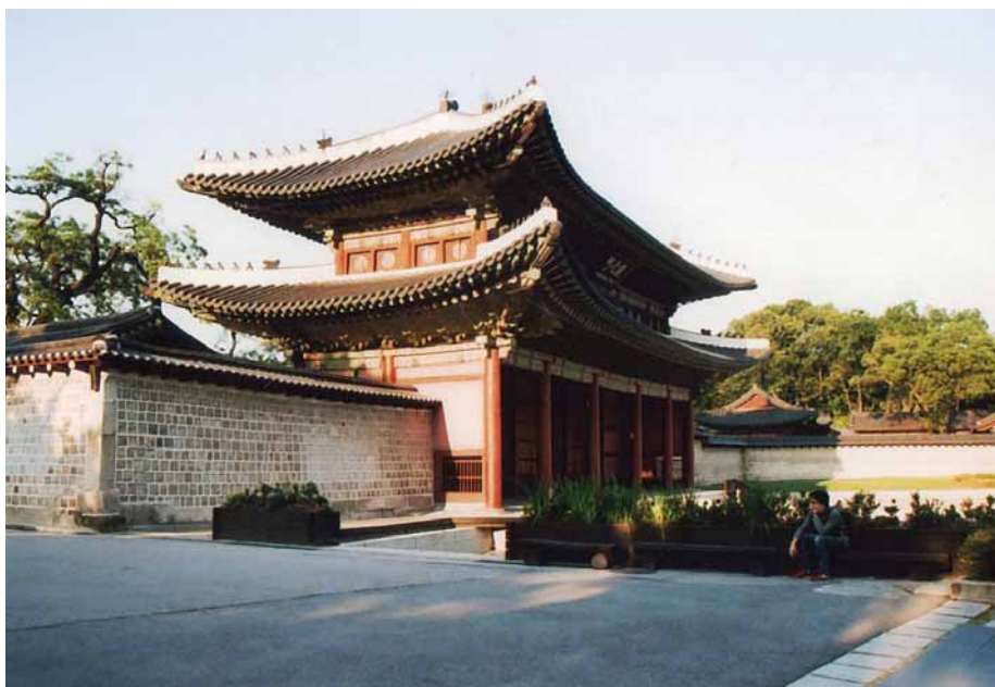
Obr. 1. Changdeokgung palác v Soulu.

V souvislosti s otázkou, jak dalece snižovat TK, je vhodné uvést klasifikaci osob, které se narodily v roce 1900. L. Rockwood z Halifaxu rozdělil tyto osoby na 3 kategorie: fit, less fit a frailty (křehký). Skupina frailty se vyznačovala pomalým pohybem, slabostí, ztrátou váhy, poklesem aktivity a exhaucí. Všechny tři skupiny měly srovnatelný benefit z léčení TK, ale skupina frailty měla více vedlejších účinků. Je třeba poznamenat, že 80 % všech hypertoniců je starších 70 let (M. Weber), tzv. frailty index, který vyjadřuje míru postižení, se zvyšuje s věkem.