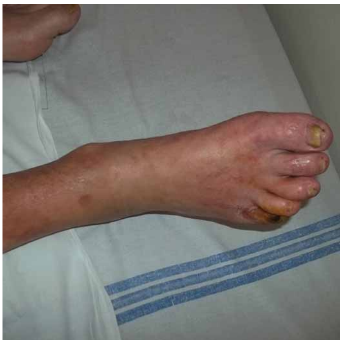
Obr. 9. Končetina po zákroku.