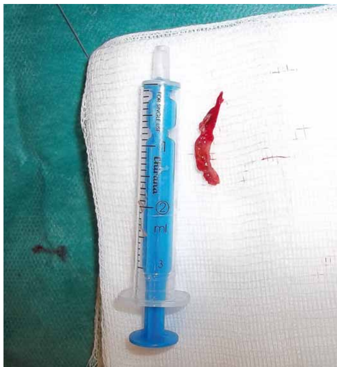
Obr. 5. Aspirovaný cca 15mm červenobílý trombus.