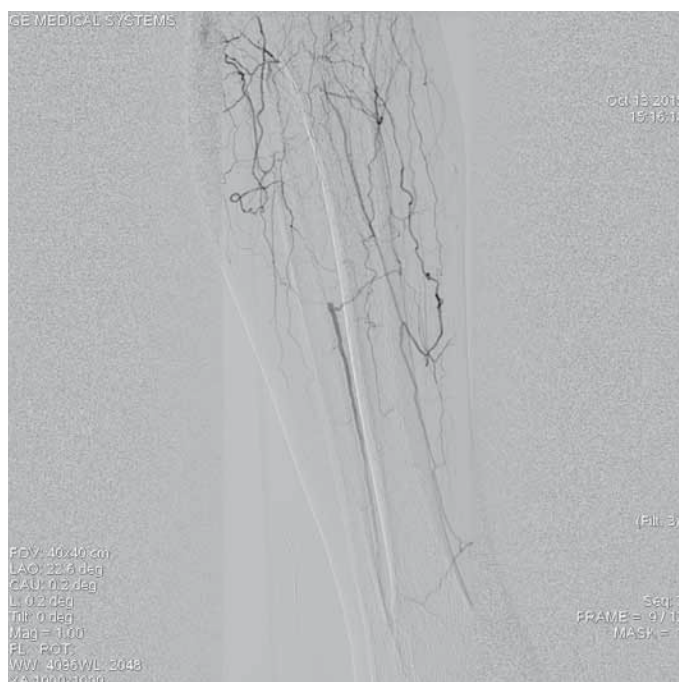
Obr. 3. Uzávěry odstupů bérkových tepen.