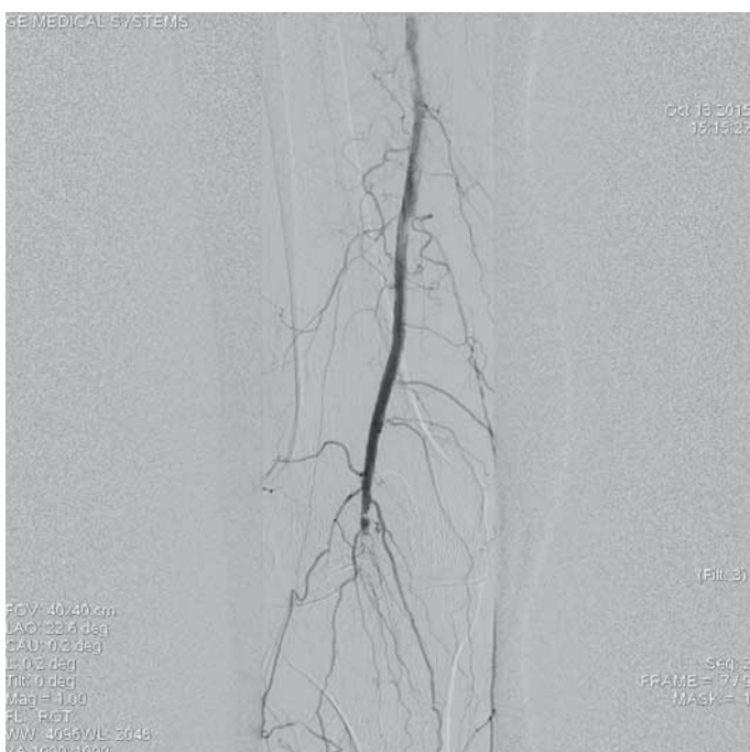
Obr. 2. Aterotrombotický uzávěr popliteální arterie vpravo.

V lokální anestezii byla provedena antegradní angiografie PDK s nálezem uzávěru APo s kolaterálním oběhem, kterým se plní ATA na rozhraní proximální a střední a třetiny bérce s chabým výtokem do difuzně ateroskleroticky postižené ADP. A. fibularis (AFib) se plní od proximální třetiny s difuzním postižením v celém průběhu až nad kotník (obr. 2–4). Poměrně snadno se daří proniknout uzávěrem APO směrem do ATA se zavedením katetru k lokální kontinuální trombolýze. Angiografická kontrola po 24 a 48 hod ukazuje jen k minimální rekanalizaci s patrnou perikaterální trombólou. Lokální trombolýza ukončena a provedena mechanická rekanalizace uzávěru systémem Rotarex®, která byla doplněna aspirační trombektomií cca 15 mm velkého trombu z trunku tibiofibulárního (TTF) (obr. 5). Následně dilatovány ATA a AFib v celé délce balonkovými katetry 3,0 x 300 mm a 2,5 x 300 mm. Kontrolní angiografie prokazuje významné zlepšení perfuze bérkových tepen s významnou reziduální trombólou. K optimalizaci nálezu a lýze reziduální trombólou byl znovu zaveden trombolýtický katetr a během následných 24 hod dochází k úplné rekanalizaci APO s táhlou reziduální 60–70% stenózou, která byla ošetřena lékem potahovaným balonkovým katetrem 5,0 x 100 mm. Na bérčovém řečišti byly detekovány reziduální stenózy jak v odstupu ATA, tak v oblasti