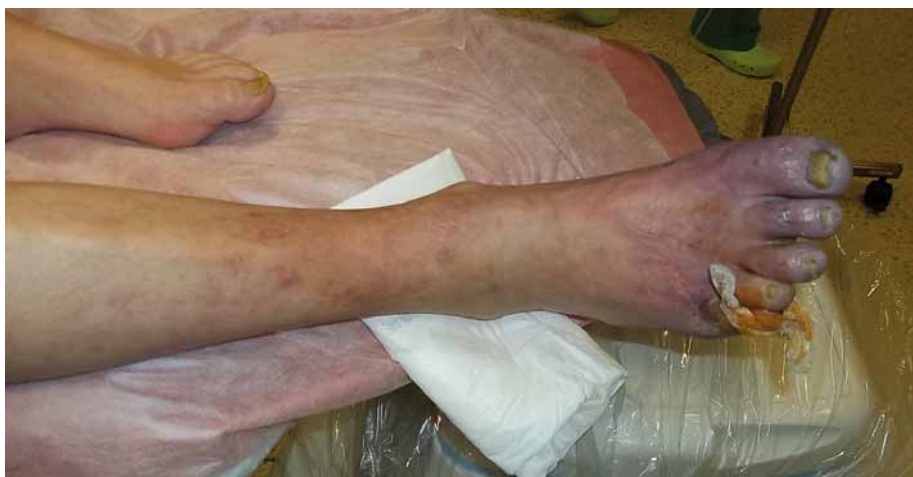
Obr. 1. Obrázek kritické končetinové ischemie s lividním zbarvením prstů a gangrenou V. prstu pravé dolní končetiny.

kální léčba. Pacientovi změněna antikoagulační léčba z warfarinu na rivaroxaban, nasazena antibiotika (Dalacin) a pacient propuštěn po týdnu hospitalizace do domácího ošetřování a předán do péče ambulance chronických ran.