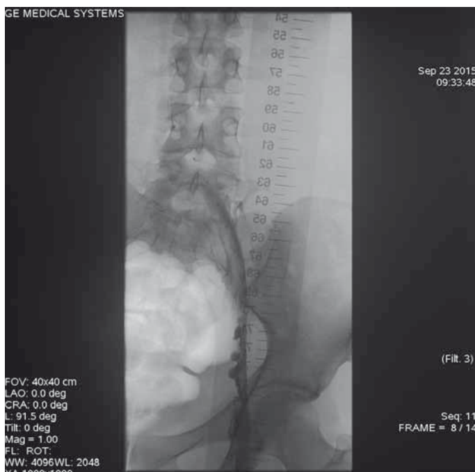
Obr. 2. Angiografie ileofemorální trombózy během lokální trombolitické terapie (LKT) – parciální lýza vysoké trombózy levé dolní končetiny (v levostranných hlubokých žilách zaveden katetr systému EKOS – ultrazvukem enhancovaná LKT).