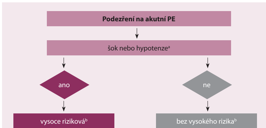
Obr. 1. Bazální riziková stratifikace akutní PE.

PE – plicní embolie, a definováno jako systolický krevní tlak < 90 mm Hg, nebo pokles systolického tlaku krve o ≥ 40 mm Hg, po dobu > 15 min, pokud toto není zapříčiněno čerstvě vzniklou arytmií, hypovolemií, nebo sepsí, b na základě odhadu PE vyžadující hospitalizaci, nebo dle 30denní mortality.