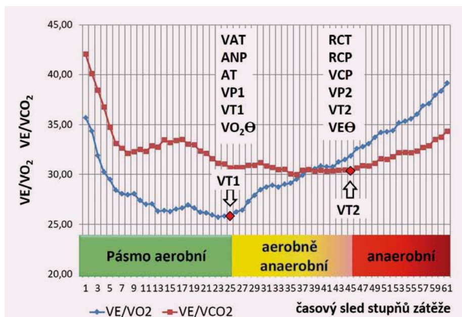
Obr. 1. Názvoslovné ekvivalenty ventilačních prahů stanovených při spiroergometrickém vyšetření.

Stanovením VT1 a VT2 lze pak u každého pacienta určit rozmezí jednotlivých pásem –