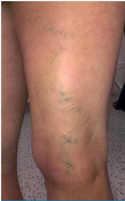
Obr. 3. Varixy zadní strany stehna v oblasti insuficientní v. Giacomini.

lesti u 54 % žen a k významnému zlepšení u dalších 23 % [8].