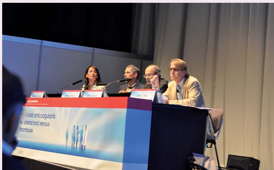
Panelové diskuse o roli dabigatranu v indikacích arteriální i žilní trombózy se zúčastnili (zleva) S. Middeldorpvá, S. Connoly, S. Schulman a M. Crijns.

„Registr zahrnuje cca 4 000 pacientů s dabigatranem 110 mg i 150 mg a asi 9 000 pacientů s warfarinem. Je zde případová case-control evaluace, tzn. porovnané skupiny jsou spárovány podle více srovnatelných rizikových faktorů. Porovnání je tedy dobře vypovídající – a i z něj vyplývá, že procento závažných krvácení je v klinické praxi