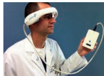
Obr. 6. CLOTBUST-ER (Cerevast Therapeutics).

ných sonografistů. Jednou z možností, jak sonotrombolýzu uvést do běžné praxe, je vytvoření automatických přístrojů, které nevyžadují přítomnost zkušeného operátora. Pilotní studií s přístrojem CLOTBUST-ER firmy Cerevast (obr. 6) byla studie CLOTBUST-HF . Do studie bylo zařazeno 20 pacientů s proximální intrakraniální okluzí (70 % ACM, medián NIHSS 15). Všichni pacienti tolerovali dvouhodinovou insonaci přístrojem a u žádného nedošlo k rozvoji IC krvácení. Po 2 hod bylo plné rekanalizace dosaženo u osmi pacientů (40 %) a u dvou pacientů (10 %) došlo k rekanalizaci parciální. Tyto výsledky jsou velmi povzbudivé, je dosaženo minimálně dvojnásobné rekanalizace oproti sa-