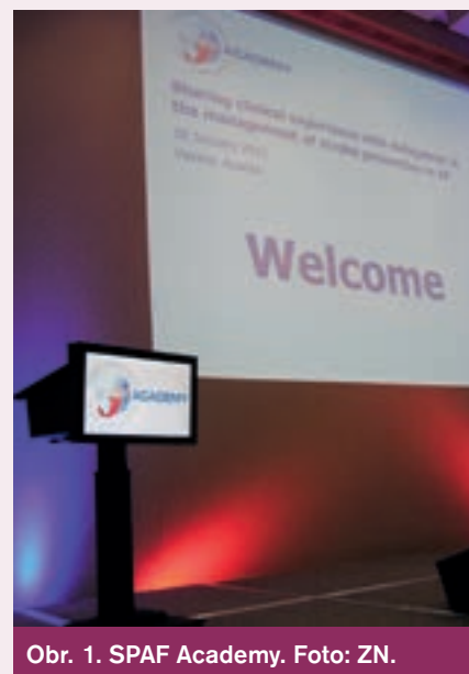
Obr. 1. SPAF Academy.

Analýza závažných krvácení s fatálními následky ve studii RE-LY prokázala významně nižší mortalitu u pacientů léčených dabigatranem oproti pacientům s warfarinem (relativní riziko 0,56 pro dabigatran 150 mg a 110 mg ve srovnání s warfarinem, p = 0,009 ). Navíc u pacientů léčených dabigatranem byla ve studii RE-LY zaznamenána významně kratší průměrná délka pobytu na JIP a koronární JIP oproti nemocným s warfarinem (1,6 vs 2,7 noci, p = 0,01 ).