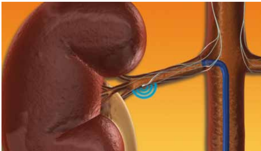
Obr. 1. Místo aplikace radiofrekvenčního proudu v renální tepně (Medtronic, Česká republika).

tak vede ke snížení noradrenalinu v ledvinách, což se projeví snížením tvorby reninu a zvýšením průtoku renální tepnou. Snížením aferentních impulzů vedoucích z ledvin do CNS dochází k poklesu celkového tonu sympatiku.