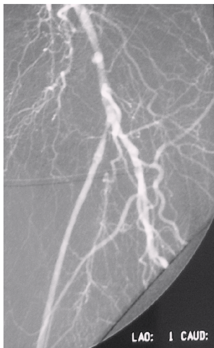
Obr. 4. DSA obraz zlyhávajúceho femoropopliteálneho distálneho bypasu s autológnu reverznou vena saphena magna na ľavej dolnej končatine rok po implantácii. Prítomná stenóza v odstupovej časti bypasu, odstupový uzáver artéria femoralis superficialis.

Sekundárne arteriálne rekonštrukcie po trombotizácii protetických bypasov môžeme rozdeliť do dvoch skupín. Do prvej patria výkony spojené s trombektómiou, revíziou a pokusom o záchranu pôvodnej protézy. Do druhej patria výkony, pri ktorých implantujeme nový bypas so žilou. Na našom pracovisku sa o ďalšom postupe po trombotizácii bypasu rozhodujeme po vykonaní DSA vyšetrenia. Častým problémom u pacientov v našom súbore bola ich polymorbidita s vysokým výskytom pridružených ochorení [7–10]. Chirurgická revaskularizácia je relatívne kontraindikovaná pri nádorových ochoreniach [11–15]. Progresia aterosklerózy je najčastejšou príčinou trombotizácie [16].