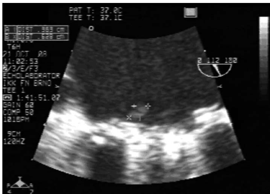
Obr. 1. Hyperechogenní útvar velikosti 4 × 7 mm v oblasti mitrálního anulu.