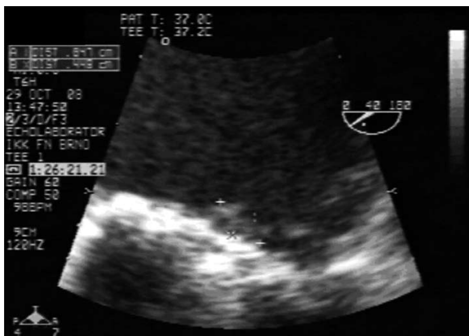
Obr. 2. Viditelná progresse s nálezem 2 hyperechogenních útvarů vel. 4 × 8 mm a 4 × 4 mm.

se podařilo zvládnout přelčením antibiotiky dle citlivosti. Pacient byl propuštěn domů dne 12. 11. 2008 afebrilní, tlakově a kardiopulmonálně kompenzovaný. Pacient byl s odstupem měsíce při ambulantní kontrole v klinicky dobrém stavu, subjektivně bez obtíží, účinně antikoagulovaný, bez krvácivých projevů a kontrolní TEE bez nálezu patologických nitrosrdečních útvarů. V průběhu ambulantního sledování, které probíhá doposud, je pacient kardiopulmonálně kompenzovaný bez projevů nových tromboembolických příhod.