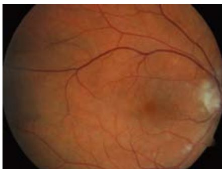
Obr. 1. Oční pozadí – pacient, muž, rok narození 1946. Sukcesivní embolizace, cca 48 hod od vzniku prvních obtíží, vizus 0,5.