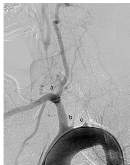
Obr. 3. Angiografický obrázek Takayasu arteritidy v chronickém stadiu s obliteracemi magistralních mozkových tepen. Mozek je zásobován jedinou mohutnou vertebrální tepnou. a – obliterace pravé společné karotidy, b – obliterace levé společné karotidy, c – obliterace levostranné podklíčkové tepny.

Léčba chronické periaortitidy a retroperitoneální fibrózy závisí na stupni renální insuficience. V případech pokročilého renálního selhání je indikováno včasné odstranění obstrukce močovýchodů a to buď retrogradní katetrizací ureterů, nebo perkutánní nefrostomií. Následuje operační řešení spočívající v uvolnění močovýchodů z okolního vaziva. Postoperačně je doporučována léčba kortikoidy k zabránění progresu onemocnění. V případě absence významnější renální insuficience doporučuje řada autorů primárně postupovat konzervativně a nemocné léčit kortikoidy. Ty vedou k ústupu systémových příznaků i ústupu uretrální obstrukce [23].