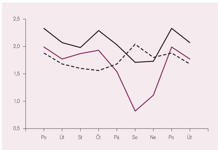
Obr. 1a. Týdenní variace kardiovaskulární nemoci a úmrtnosti (průměrné denní počty připadající na příslušný den v týdnu). Na vodorovné ose dny v týdnu (pondělí a úterý se opakuje pro větší názornost). Černě – PCI provedené v letech 2004–2006 v Brně, černě přerušovaně – náhlá kardiovaskulární úmrtí mimo nemocnici v obvodu Brno II v letech 1975–1983 (násobeno čtyřmi), vínové – ambulantní příjmy s kardiovaskulárním onemocněním za 18 měsíců 1972–1974 v Brně II.