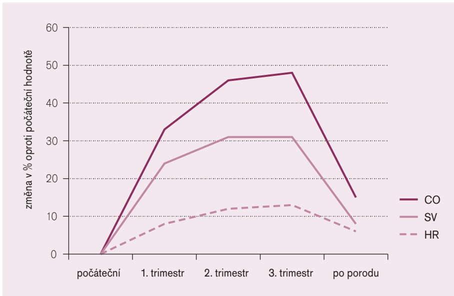
Graf 1. Změny systémové hemodynamiky v těhotenství.