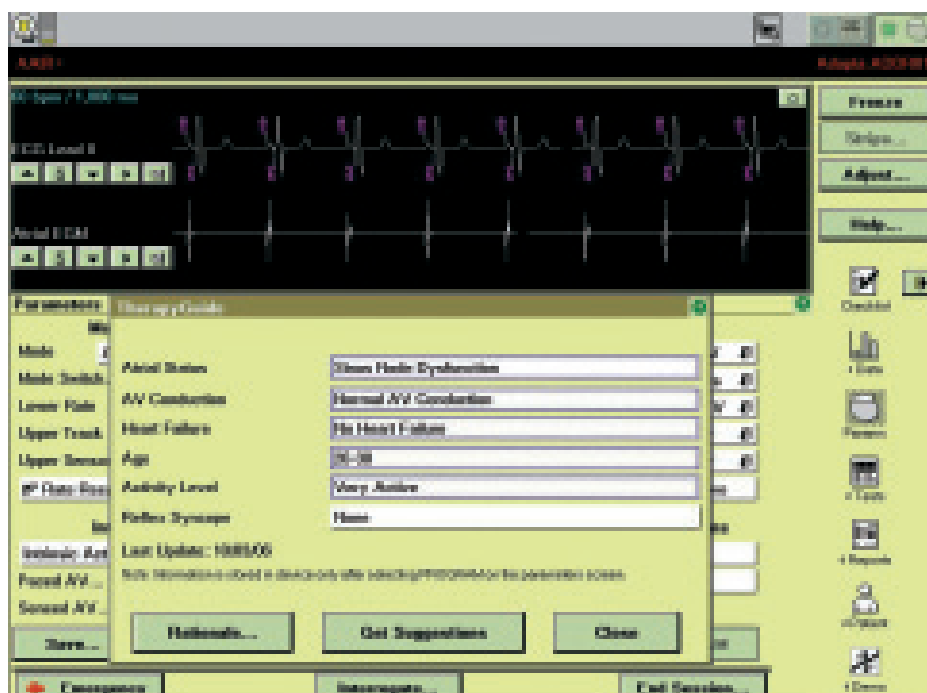
Obr. 2. TherapyGuide: Ukázka charakterizace pacienta pro návrh změn v programaci. K získání návrhu změn programace je nutno stisknout tlačítko „Get Suggestions“.

mované sekvence antitachykardické stimulace či výbojů. Způsob, jakým je frekvenční limit definován, závisí na výrobci přístroje, přičemž některé součásti této definice se dají programací ovlivnit. U některých přístrojů je třeba ke splnění frekvenčního limitu ještě nastavit dobu trvání arytmie v sekundách, u jiných se nastavuje, kolik cyklů z určitého počtu cyklů musí vyhovět frek-