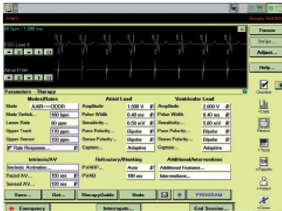
Obr. 3. TherapyGuide: Po stisknutí tlačítka „Get Suggestions“ se objeví obrazovka se základními parametry programace. Navržené změny jsou orámovány modře.

mus je určen k ochraně proti všem supraventrikulárním akceleracím rytmu, ať již sinusové tachykardii, či síňové tachykardii, flutteru síní či fibrilaci síní. Problémy mohou vzniknout při frekvenčně závislém raménkovém bloku či jiné aberci QRS za supraventrikulární tachykardie.