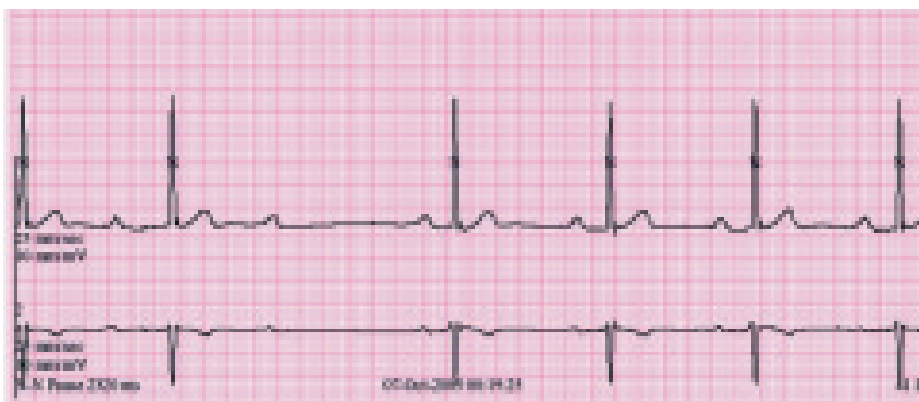
Obr. 2. Záznam AV-blokády II. stupně Wenckebachova typu v nočních hodinách při holterovské monitoraci EKG (48letý sportovec, jehož EKG-křivka je na obr. 1).

sportovní anamnézy, vyloučení organického srdečního onemocnění. Je třeba cíleně pátrat po symptomech, nesmějí se podcenit varovné signály. V případě symptomatických bradyarytmií je nutno zvážit implantaci trvalého kardiostimulátoru, který sám o sobě nepředstavuje kontraindikaci sportovní aktivity, vyžaduje pouze opatrnost při kontaktních sportech. Pro řadu našich sportujících „nemocných“ je zákaz sportovních aktivit zásadním negativním zásahem do kvality života a měl by být vždy racionálně zdůvodněn. V praxi bychom většinu pacientů měli ke sportovní aktivitě spíše povzbuzovat.