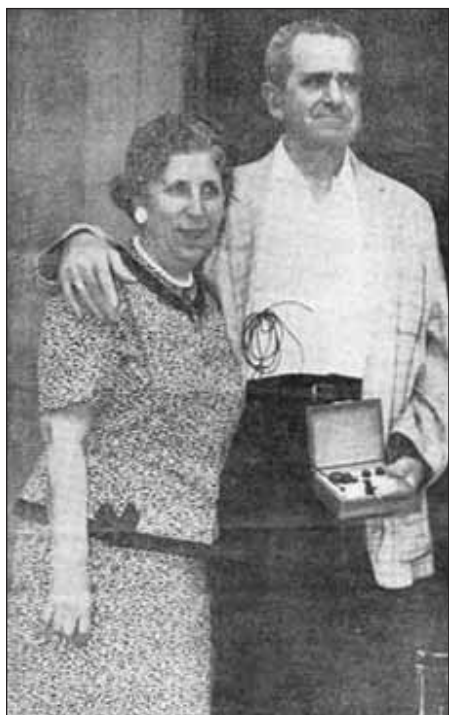
Obr. 2. Pacient s dlouhodobou externí kardiostimulací přes intravenózně zavedenou elektrodu. Pacient přežil s tímto typem stimulace od května 1959 do listopadu 1962.

vývoje společnosti Elema-Schönander, která se později stala součástí firmy Siemens-Elma. Tato firma se specializovala na vývoj a výrobu kardiostimulátorů. V roce 1994 byla prodána americké společnosti Pacesetter, která byla později prodána firmě St. Jude Medical.