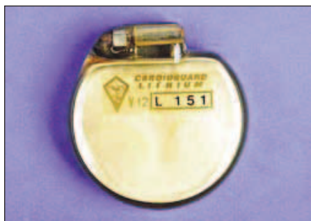
Obr. 5. Jeden z prvních kardiostimulátorů vybavených lithiium-jodidovou baterií. Tento model (V12-L151 firmy LEM) pochází z Itálie z roku 1975.

Lithiová baterie se na rozdíl od zinko-rtuťové baterie těší řadě výhod. Vysoká energetická denzita umožnila výrobcům zmenšit rozměry generátoru (obr. 5). Napětí pulzu klesá kontinuálně s vybíjením oproti náhlému poklesu u zinko-rtuťového článku a dává možnost lékaři včas odhadnout nutnost elektivní výměny. Životnost byla odhadována podle modelu na 5 až 10 i více let. Při vybíjení nevzniká žádný plynný meziprodukt a generátor může být hermeticky uzavřen.