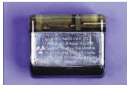
Obr. 6. Nukleární kardiostimulátor vybavený termočlánkem s plutoniem 238. Tento model Nu-5D vyrobený firmou Arco Nuclear Co. pochází z roku 1976.

Rozvoj 2dutinové stimulace, zahájený už v 60. letech, získal. V USA, kde implantovat mohl jakýkoliv lékař bez nutnosti získání akreditace, byl počet implantujících extrémně velký, a tudíž průměrné počty implantací na 1 lékaře malé, často do 10 pacientů do roka. Implantací zkušenosti byly sporé a znalosti technické stránky věci ještě menší. Ač již byly k dispozici programovatelné kardiostimuláto-