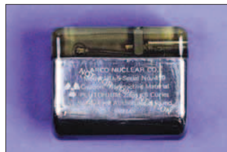
Obr. 6. Nukleární kardiostimulátor vybavený termočlánkem s plutoniem 238. Tento model Nu-5D vyrobený firmou Arco Nuclear Co. pochází z roku 1976.

Rozvoj 2dutinové stimulace, zahájený už v 60. letech, vážnul. V USA, kde implantovat mohl jakýkoliv lékař bez nutnosti získání akreditace, byl počet implantujících extrémně velký, a tudíž průměrné počty implantací na 1 lékaře malé, často do 10 pacientů do roka. Implantací zkušenosti byly sporé a znalosti technické stránky věci ještě menší. Ač již byly k dispozici programovatelné kardiostimuláto-