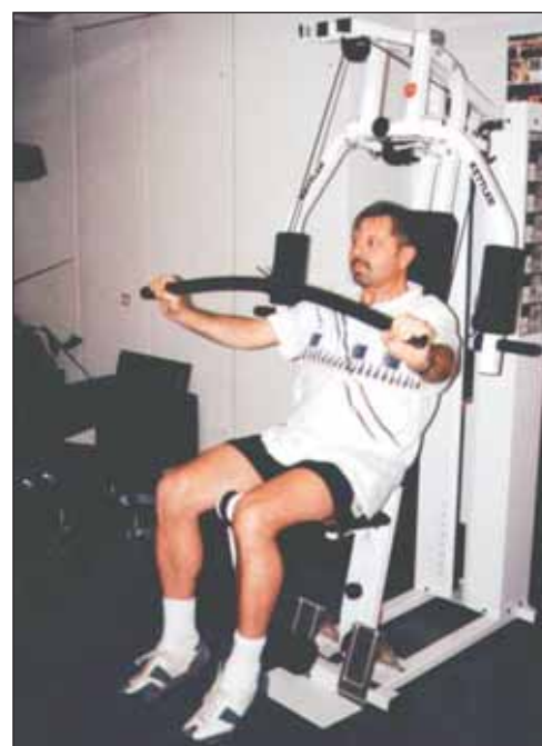
Obr. 4. Stahování zátěže.