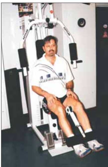
Obr. 3. Posilování nohou sounož.