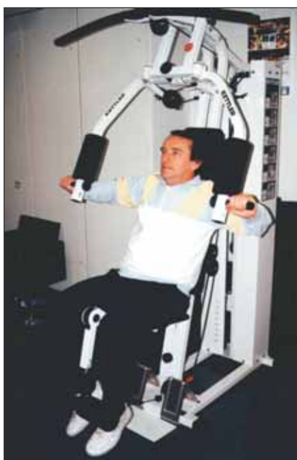
Obr. 2. Vzpírání zátěže dopředu.

Pravidelný vytrvalostní a silový trénink přináší charakteristické změny, které vedou ke zlepšení funkční kapacity a síly. Tyto změny nazýváme tréninkovým efektem a dovolují dosáhnout vyššího fyzického zatížení s nižší frekvenční odpovědí. Fyzický trénink střední in-