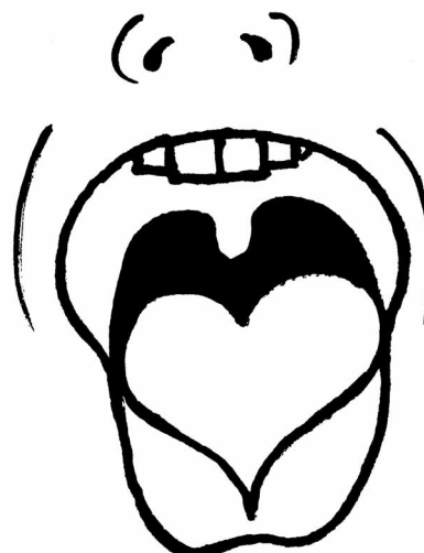
Mít srdce na jazyku – být upřímný, přímý