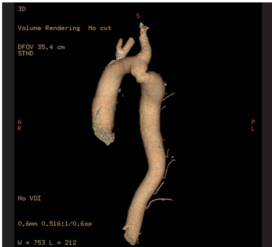
Obr. 1. Koarktace aorty diagnostikovaná u 58letého muže s rezistentní hypertenzí (zjištěnou od 18 let a léčenou od 28 let). Převzato z [10].