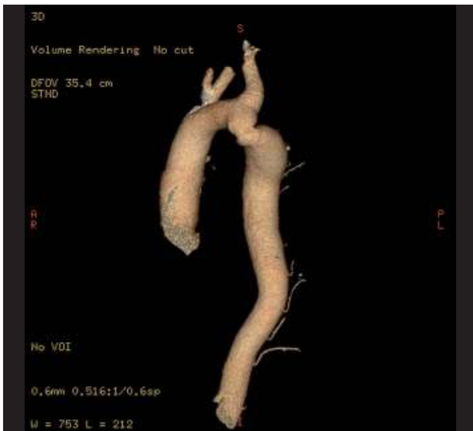
Obr. 1. Koarktace aorty diagnostikovaná u 58letého muže s rezistentní hypertenzí (zjištěnou od 18 let a léčenou od 28 let). Převzato z [10].